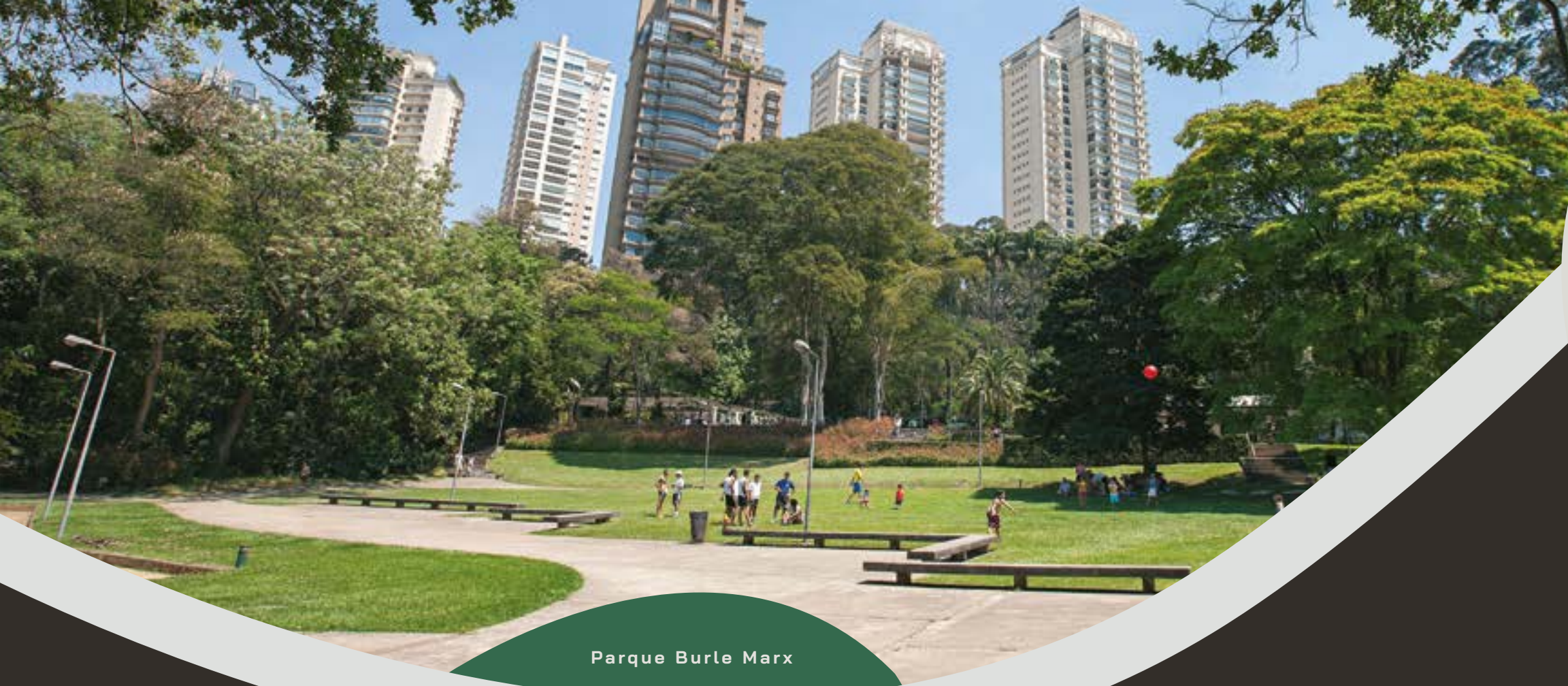
Parque Burle Marx