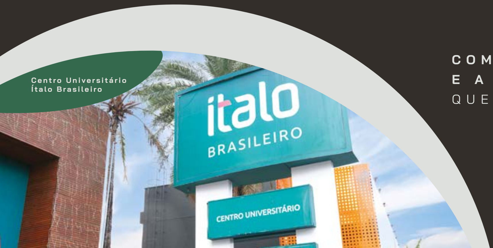
Centro Universitário Ítalo Brasileiro

COM A FACILIDADE E A CONVENIÊNCIA QUE SÓ A ZONA SUL TEM.