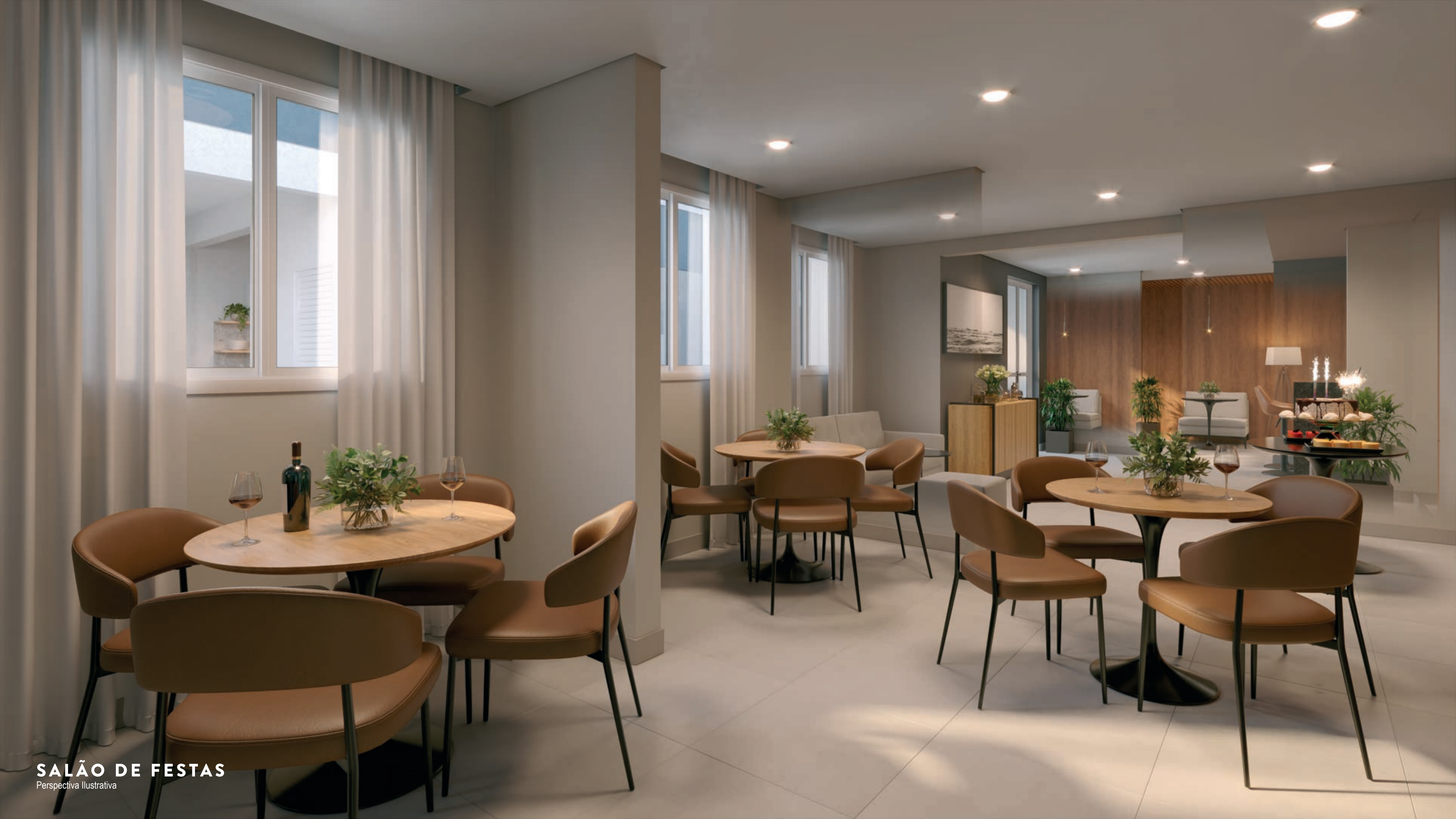
SALÃO DE FESTAS Perspectiva Ilustrativa